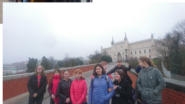
Śladami Unii Lubelskiej

29 listopada odbyła się uroczystość podsumowująca działania dotyczące projektu pod hasłem: Unia Lubelska – wielkie dziedzictwo naszego miasta!