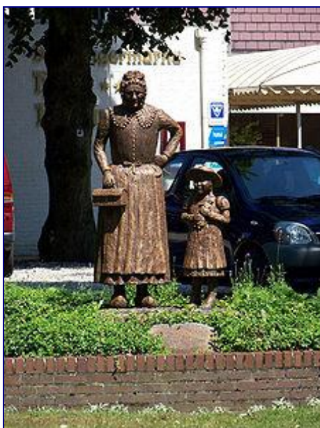
Pomnik babci i wnuczki w Odoorn (Holandia)

Dzień Babci to święto obchodzone dla uhonorowania babć. W dzień ten wnuki składają życzenia swoim babciom. W Polsce obchodzone 21 stycznia, w tym samym dniu w Bułgarii i Brazylii, a w Hiszpanii – 26 lipca.