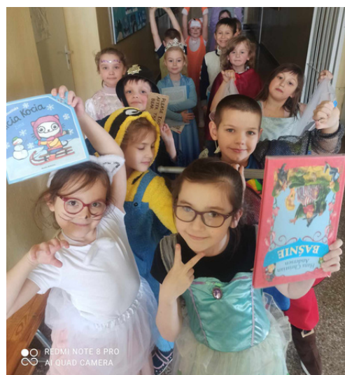
Pasowanie na czytelnika uczniów klasy Ia. Każdy mógł przebrać się za bohatera z ulubionej książki.