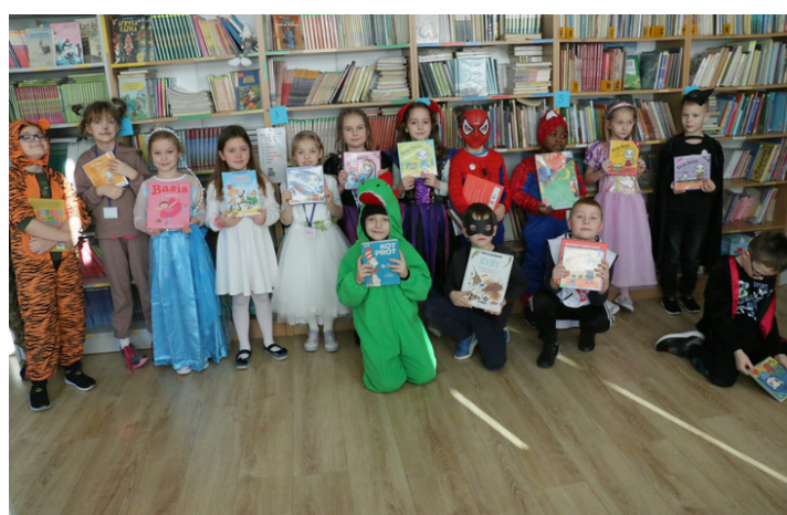
Pasowanie na czytelnika uczniów klasy Ib. Każdy mógł przebrać się za bohatera z ulubionej książki.