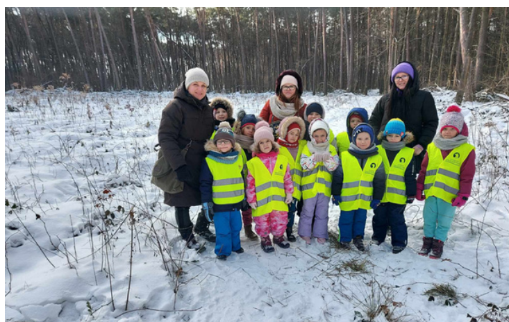
Naszym zerówkowiczom śnieg i mróz niestraszne, dlatego wybraliśmy się do Mętowa na warsztaty terenowe, podczas których tropiliśmy ślady dzikich zwierząt mieszkających w lesie.