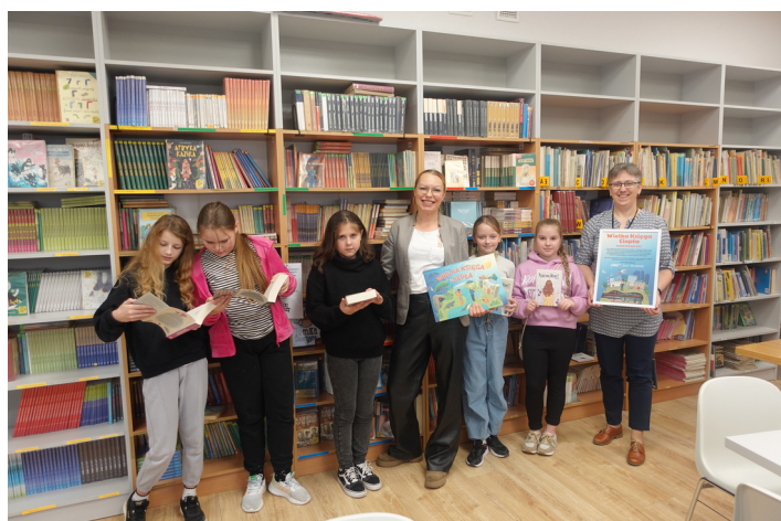
Dary dla szkolnej biblioteki w postaci ulubionych książek przekazało Lubelskie Przedsiębiorstwo Energetyki Ciepłej.