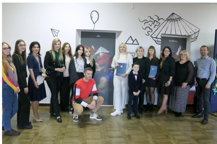
Otwarcie galerii drzwi szkolnych z udziałem zaproszonych gości i wykonawców projektu.