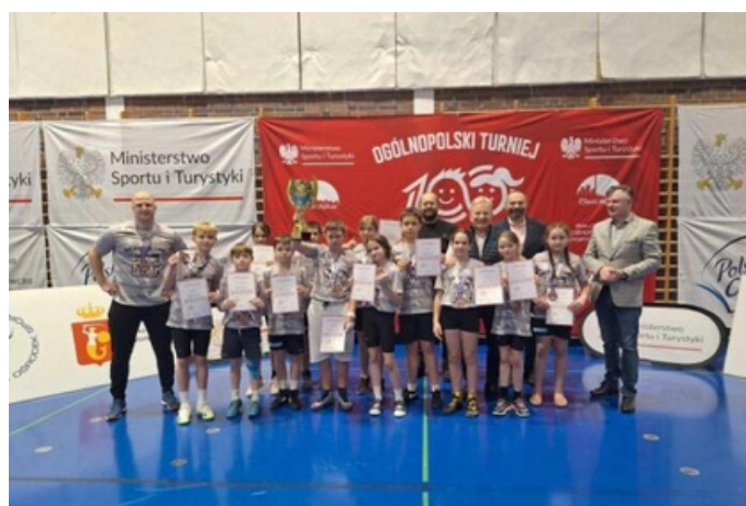
Drugi rok z rzędu zajmujemy 3 miejsce w Ogólnopolskim Turnieju „Zapasy Sportem Wszystkich Dzieci” i udowadniamy, że należymy do absolutnej czołówki w kraju.